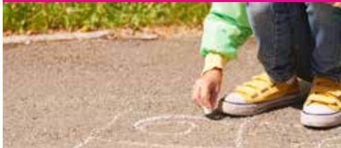
Speelpaleis verhuist p. 2