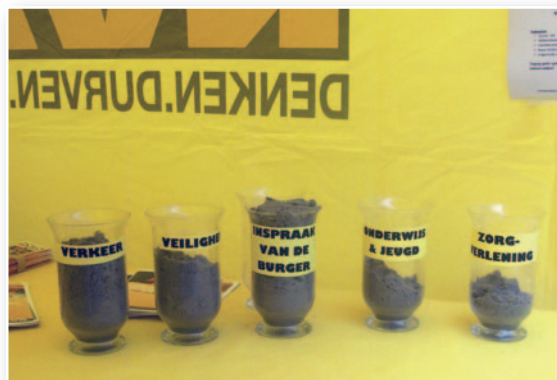
Met een schepje zand kon men aangeven welke beleidsdomeinen in Niel echt aan verbetering toe zijn.

Tot slot willen we iedereen bedanken voor de vele steunbetuigingen en massale aanwezigheid aan ons N-VA-tentje. Dit was hartverwarmend en sterkt ons in de overtuiging dat ook de Nielenaar klaar is voor politieke vernieuwing, gedragen door de N-VA.