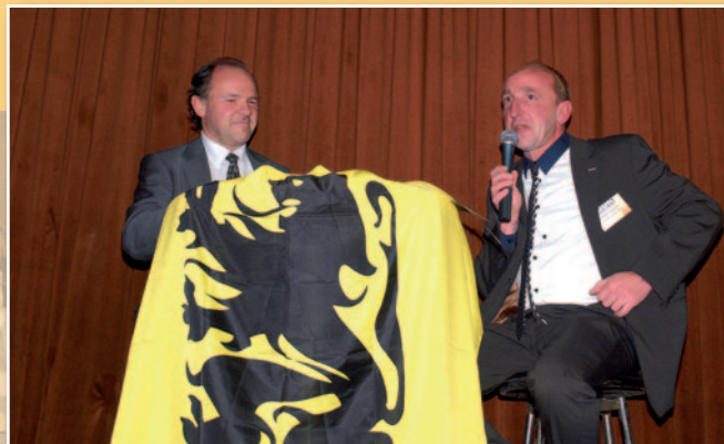
De geslaagde gespreksavond met Philippe Muyters is voor herhaling vatbaar.

Na de pauze konden de aanwezigen vragen stellen aan de minister. Hieruit bleek dat de Nielenaar bedenkingen heeft bij het huidige federale en lokale beleid op vlak van financiën, veiligheid en het communautaire luik van het regeerakkoord. Een overzicht van de vragen en antwoorden staat op onze website.