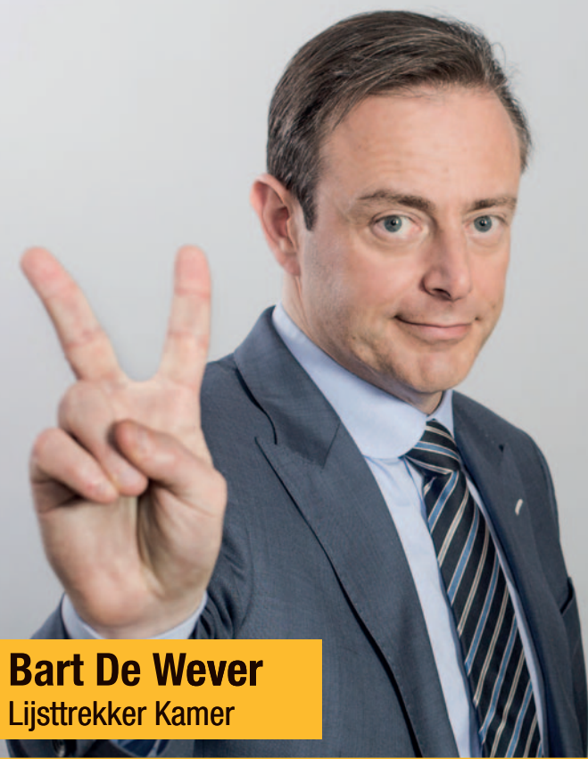
Bart De Wever Lijsttrekker Kamer

Als burger, als vader en als burgervader zoek ik elke dag oplossingen voor en het welzijn van iedereen die werkt, spaart en onderneemt. Maar zolang we België niet hervormen, staan we machteloos tegenover de hoge belastingen, de faillissementengolf, de verkwistende structuren.