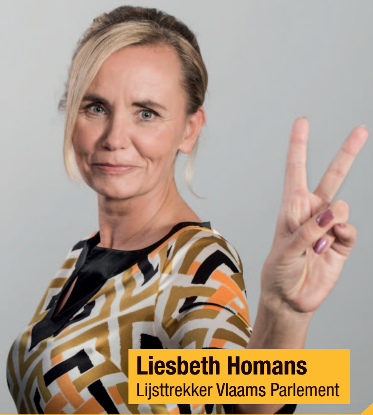
Liesbeth Homans Lijsttrekker Vlaams Parlement

“Ik wil die verantwoordelijkheid nemen. En u?”