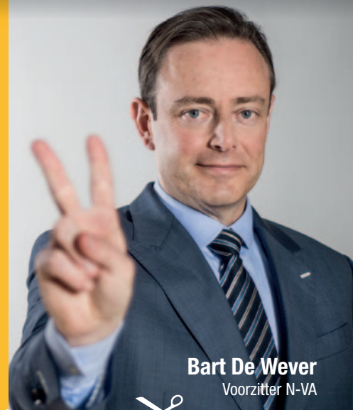
Bart De Wever Voorzitter N-VA